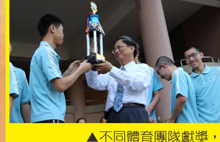
▲不同體育團隊獻獎，你能分辨各是甚麼團隊嗎