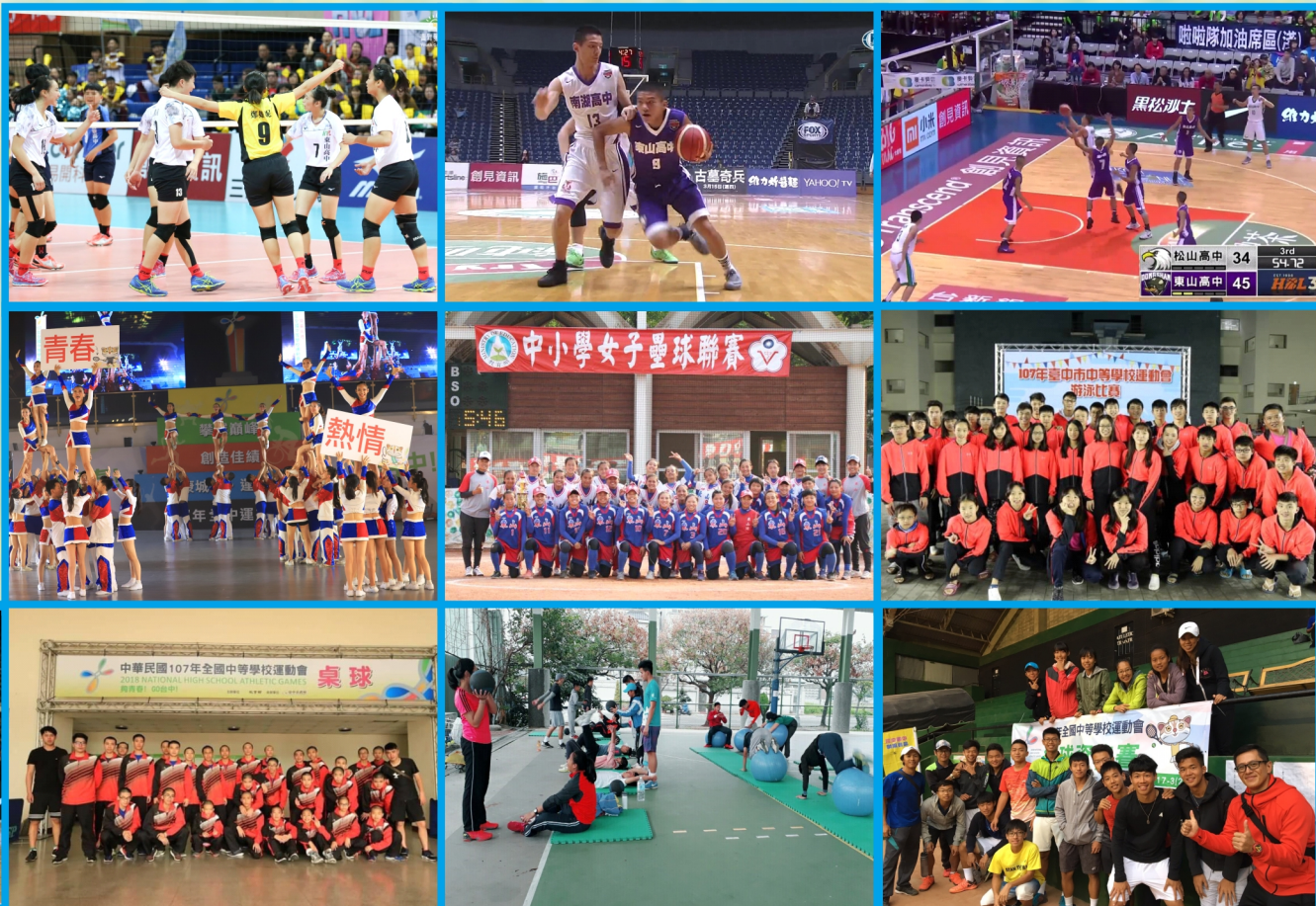
▲從日常體能技術訓練到賽場上全力以赴，不只展現自我亦成就團隊，我們的認真誠意讓媒體看見了，透過轉播分享給喜愛東山與熱愛運動的觀眾們。

體育賽事之外，「東山高中是一所沒有音樂班的音樂學校」這樣特色一直展現著，國中部管樂隊參加106學年度全國音樂比賽行進管樂70人以下類組榮獲優等第二名，平時，國中直笛或是高中合唱比賽，都可以見到各班師生用心經營努力練習，在音樂薰陶下各個是如癡如醉，好生幸福。學術上，不僅大學入學繁星推薦榮登台政成清交各大學榜單，國中科展以「鷹架中的祕密」獲得台中市第三名，處處展現東山的允文允武。