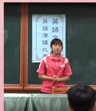
英語演講比賽看各選手精采的演出