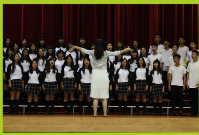
▲一二三部合聲的音樂饗宴，投入情感唱出曲子的輕快、哀愁、淒美或是雄壯