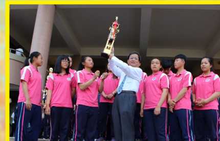
▲不同體育團隊獻獎，你能分辨各是甚麼團隊嗎