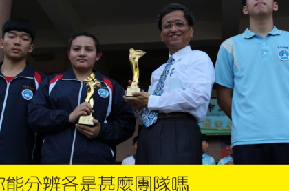
▲不同體育團隊獻獎，你能分辨各是甚麼團隊嗎