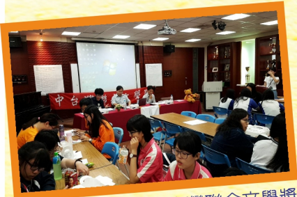
同學參加第15屆中臺灣聯合文學獎小說組決賽會議，凝聽評審的講評與指導

過幾個在那所郭先生任教學校的學生說過的；他們的老師被開除，失業了。這該不會…不對呀！郭先生怪叫了一聲，「我好像是，拿了繩子…。」最是注重形象的他愣愣的杵在那，僵硬的、緩慢的晃動著頭。伴著略有些灰暗的天空，陰冷的風陣陣吹拂，氣氛凝滯。 這會兒功夫，老民也出了問題。他因爲緊張而抓住胸口衣襟的手居然有血，一滴滴的落地。這可讓我們全都慌了神，每個人的腦袋都是脹的發痛！「槍、槍、槍決，老民，你是不是到處招搖碎嘴，被抓去槍決了？」老泰聲音顫抖的猜測。老民在他吐出槍決這兩個字的時候就嚇的渾身一抖，手緩緩的放開了衣襟，他低頭一看，彷彿還能在裡頭找到子彈一般。老民神情恍惚，「是…是了…」他甚少有一句話是這麼少的字。「我也想起來了…他們，他們告發我是匪諜。可我不是，我不是…」唉！政府，政府。那樣的腐敗，無廉無恥，誰會信服？當初信誓旦旦的承諾，都是自欺欺人的謊言。即將來臨的不會是美好的生活，苦難反而蓄勢噴發。他們帶給我們的唯有那猜忌度疑、那艱難困苦、那人心惶惶。 這一遭下來，那些記憶好像噴湧而來一般的回想起來了。 那一天，郭老師餓的沒有力氣動彈了，他不願淪爲乞丐去偷盜。於是他放下了一生的筆，轉而拿了一把板凳、一條繩子。 那一天，專賣局的人查緝了老泰的商行，老泰嘴裡叨著菸，死咬著被他們的人打呀，打呀。 那一天，子彈穿透老民胸膛，他緊張兮兮的東張西望，灰頭土臉的想找到告密者的一點訊息，懷疑的眼神從每張或憤慨或徬徨的臉上掃過。 那一天，幾個端著槍喝得醉醺醺的軍人見著安嬸的孫女長的好，就將她擄去，她不停哭鬧、扭打。安嬸追了出來，只聽那巷弄傳來兩聲槍響。 日子總不是永遠那麼太平，在這種紛亂的時代，即使我們把腰桿打直了，卻還是一樣倒下了。誰也逃不過命運的侵擾，難堪的現實擺在眼前，強硬的逼迫人們割破自己，去容納、去包容。於是便只能屈膝、低頭，或是拿起刀，或是跳下樓給自己一個了斷，就算是最後的一把尊嚴。 已經過了這麼久，久的我忘了時間、忘了我們不過是一群屍體。僅存著傷口還在控訴著不公不義，那些無法痊癒的瘡疤，儘管在土裡化成泥都仍然烙印於心；僅存著仇恨還與時間的轉軸爲伍，見證歷史；僅存著那些被淹沒的念想，埋藏在洪流裡惦記著曾經幻想裡的「國泰民安」，與裡頭所有人的笑顏。 鬼，說不得人話。