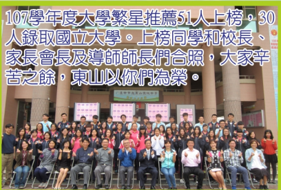
107學年度大學繁星推薦51人上榜，30人錄取國立大學。上榜同學和校長、家長會長及導師師長們合照，大家辛苦之餘，東山以你們為榮。