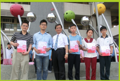
▲臺中市中小學科學展覽-國中數學組全市第三名