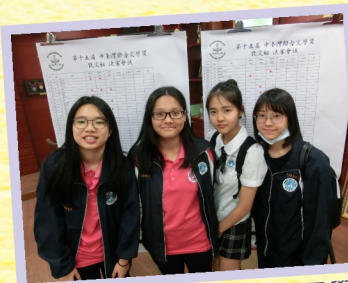
第三場散文組決賽會議同學們看看自己作品是否受到評審的青睞？