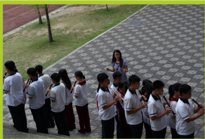
▲日常的認真練習，為班級榮譽而努力