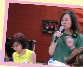
評審老師不僅涵蓋老中青三代，還是早期文學獎得主，如今已成為作家兼評審