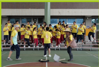
▲正式比賽秀出日常練習最好的成果