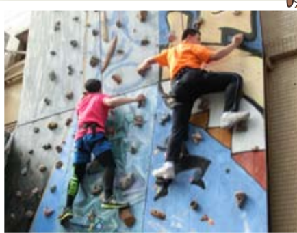
父與子同來岩場學習，人工岩場要學的除了攀岩技術外，還有信任。