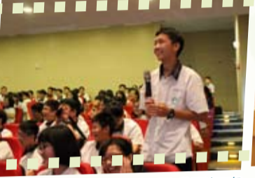
同學們對講師種種經歷感到好奇，問題不斷，歡笑聲此起彼落。