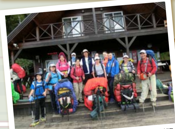
武陵大水池登山口巧遇MIT臺灣誌也來錄製節目，於是邀請麥覺明導演與大夥合影留念。