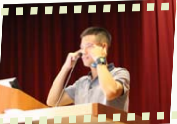
風趣的演說，加上肢體動作更讓聽講者深入其境。