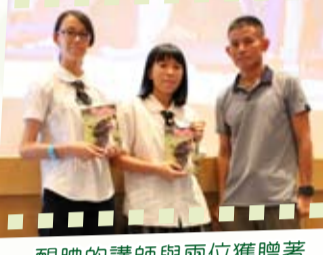
靦腆的講師與兩位獲贈著作同學合影