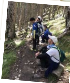
進入登雪山主峰必經的黑森林，停下來喘口氣，享受一下林間瀟灑的芬多精，寧聽森林的聲音。