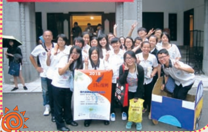
文化部2015詩的復興系列活動 現代詩歌朗誦觀摩邀請賽

文字永遠那麼奇妙，中國漢字淵遠流長，數千年歷史，在歷代文人的巧思排列組合下，各自賦予不同的意義，如今，文學更加變化多端，有了更多創意和自由的可能，然而三言兩語依舊能寫下屬於這個時代的語言，絲毫不受限制，其中它的魅力更是牽引人心，也許個人的理解有所不同，但都同樣爲詩所迷、爲詩所癡，感受它所帶來的美好，更棒的是，用不同的方式去詮釋及體會，以色彩、以畫面、以肢體，靜態或動態，都如此引人入勝，同時融合作者的創作理念以及個人看法，誕生出來的作品是獨一無二的，正因自己置身其中，更能掌握最細膩的情感，透過團隊合作，互相交流討論，彼此激發對詩作的想像，交織出一幅色彩鮮明的圖像，經過細節的修改，不斷接近大家心目中理想的模樣，過程是真正深刻的，而最叫人興奮的便是將我們的核心概念向外擴展的時候，期待爲接收者帶來觸動，此時，這個作品已有著截然不同的生命意義。