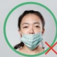
4 只遮住嘴巴·露出鼻子