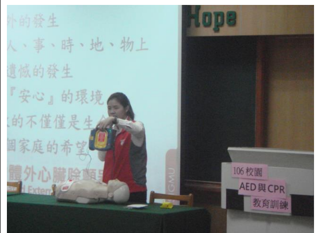
講解 AED 的操作步驟