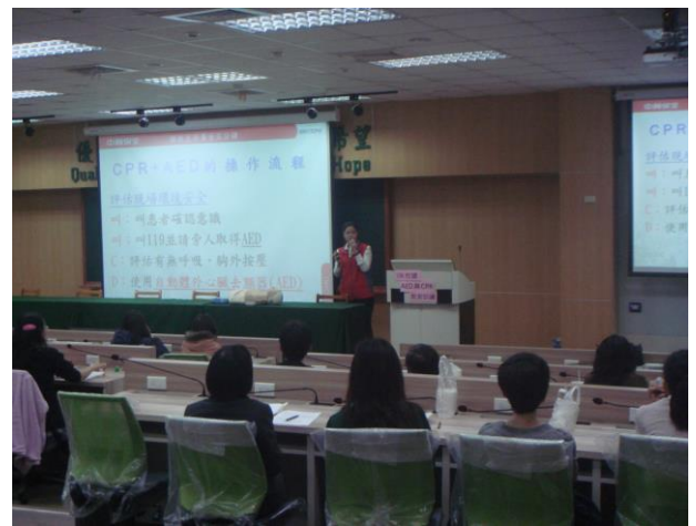
講師介紹 CPR+AED 操作流程