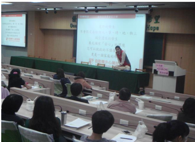
正確的手掌按壓姿勢