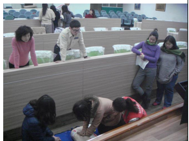
兩人一組分別互換操作 CPR、AED