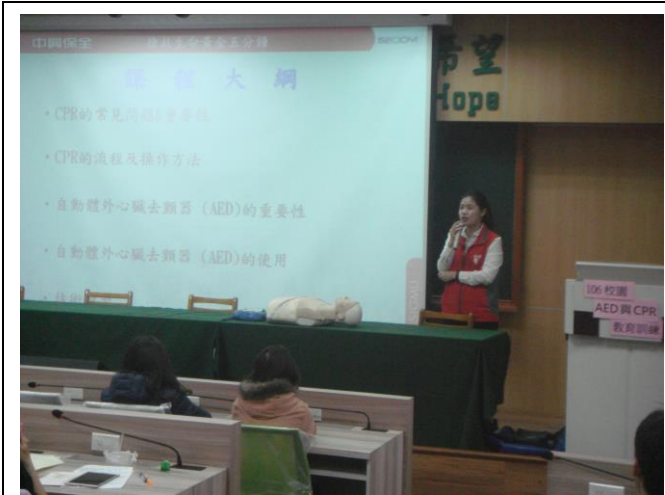
講師介紹課程大綱